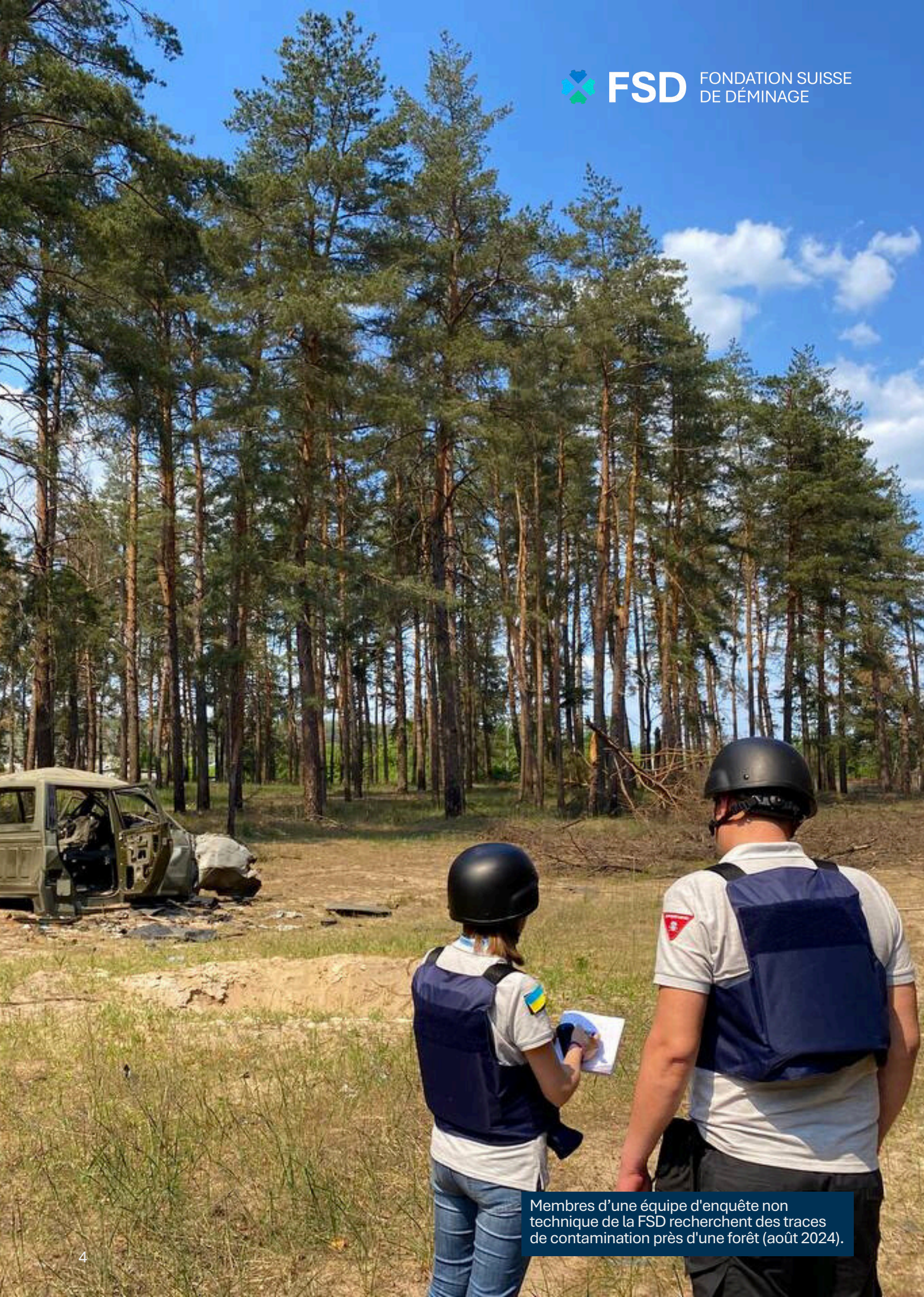
Membres d'une équipe d'enquête non technique de la FSD recherchent des traces de contamination près d'une forêt (août 2024).