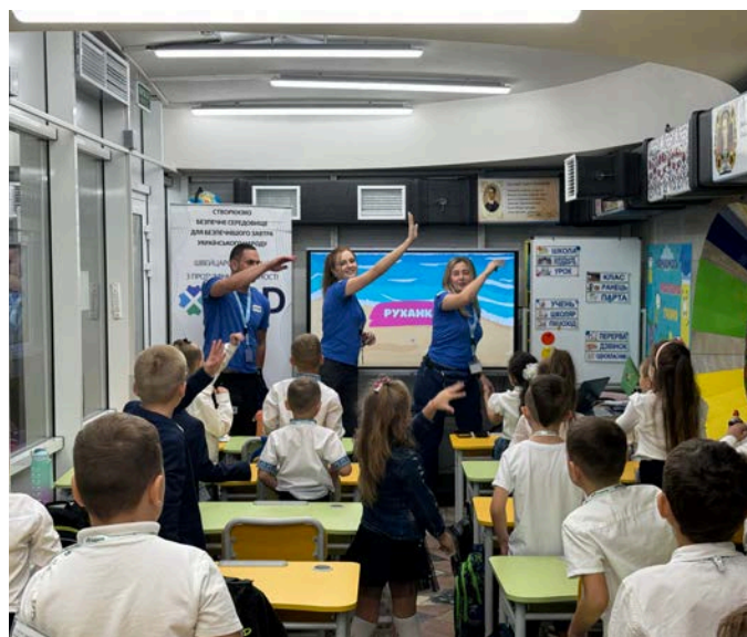
Les équipes de la FSD organisent des séances de sensibilisation aux risques à l'intention des enfants dans les écoles et les villages (septembre 2024).