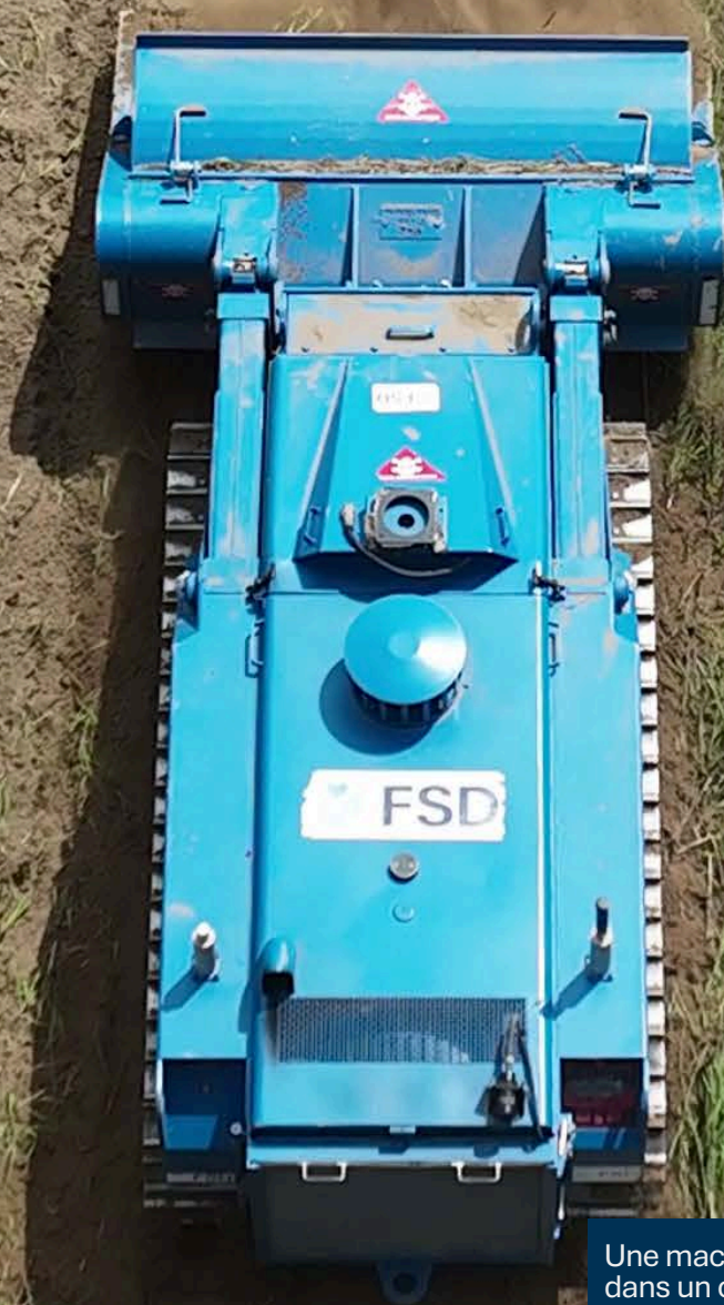
Une machine de préparation du sol de la FSD dans un champ potentiellement contaminé (mai 2024).