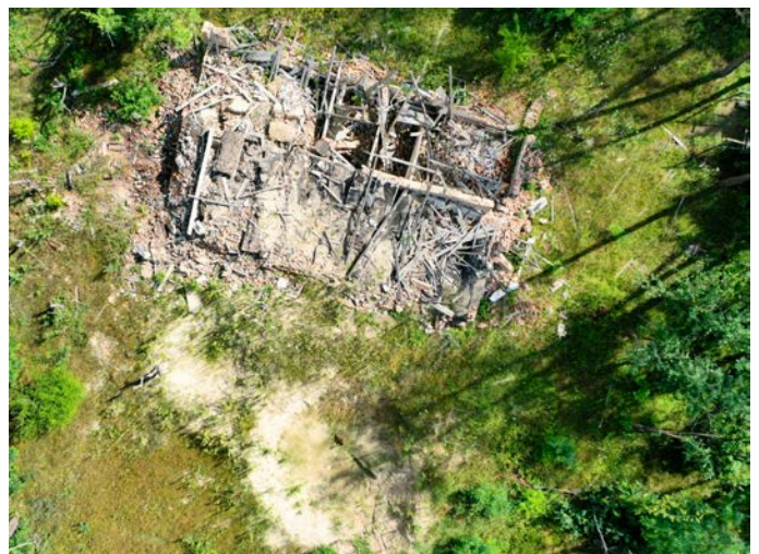
Vue aérienne, prise par un drone lors d'une enquête non technique, montrant un bâtiment détruit (juillet 2023).