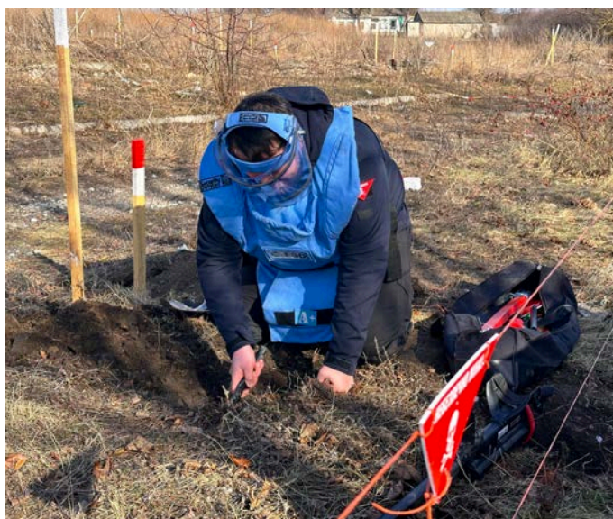
Le déminage est une tâche méthodique. Les démineur-euses inspectent le sol avec minutie, centimètre par centimètre (février 2024).

Pour 2024, le budget opérationnel de la FSD en Ukraine s'élève à 35 millions de francs suisses. Des propositions sont actuellement examinées par différents partenaires institutionnels pour amplifier notre action et accélérer le déminage du pays.