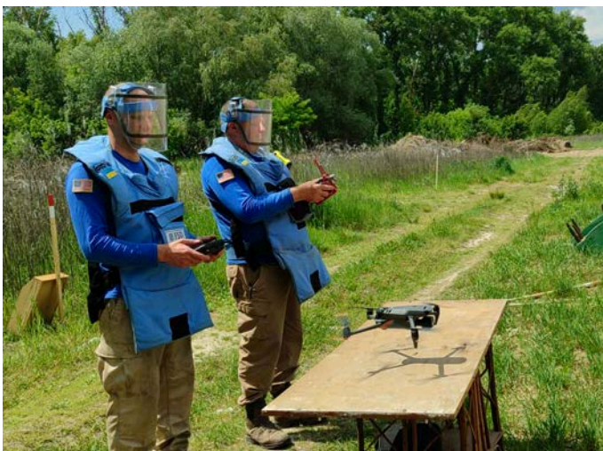
Formation du personnel de la FSD à l'utilisation de drones pour les enquêtes non techniques (juillet 2024).

En 2023, la FSD a continué de renforcer ses capacités opérationnelles grâce au recrutement et à la formation de personnel, ainsi qu'à l'acquisition de matériel. En 2024, deux bureaux satellites d'opérations ont été ouverts près de Sloviansk, dans la province de Donetsk, et à Kryvyi Rih, pour desservir la partie nord-est de la province de Kherson.