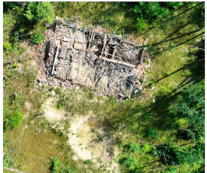
Vue aérienne prise par un drone montrant un bâtiment endommagé lors d'une enquête non technique (juillet 2023).