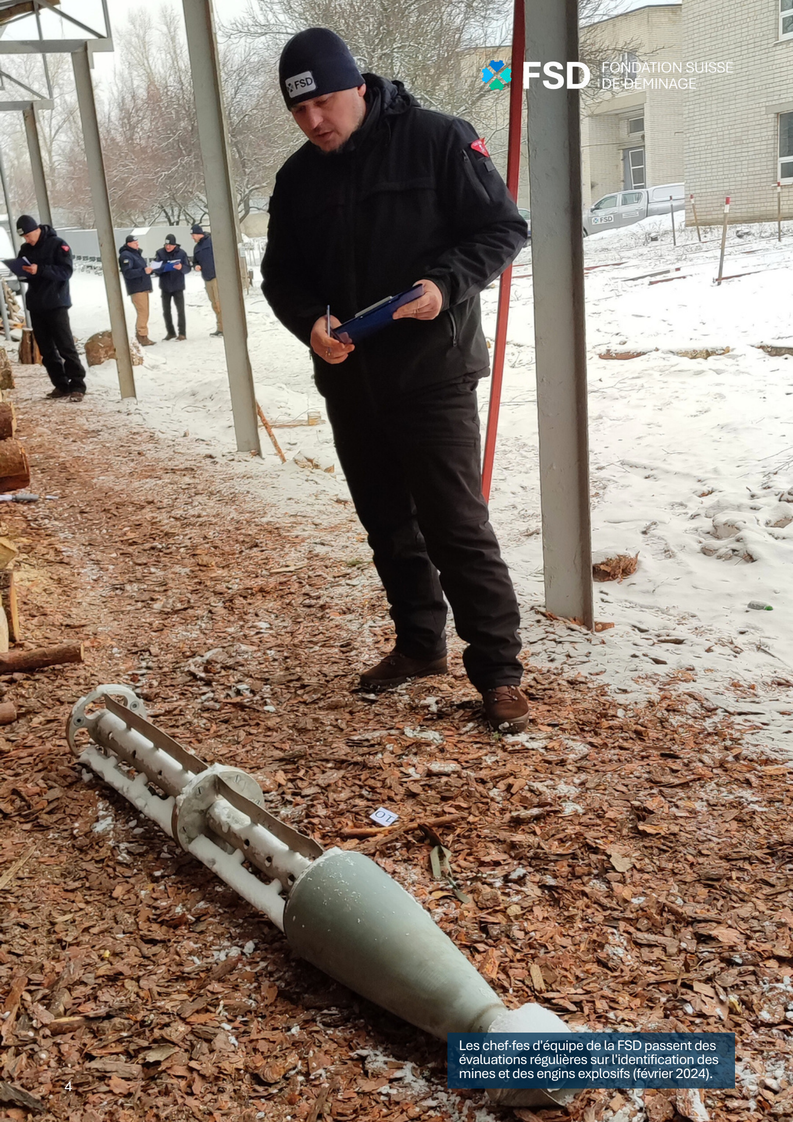
Les chef-fes d'équipe de la FSD passent des évaluations régulières sur l'identification des mines et des engins explosifs (février 2024).