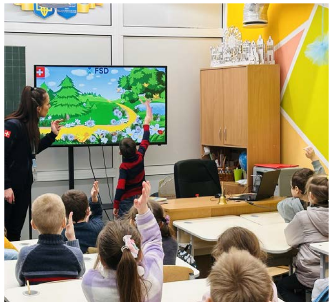
Les équipes de la FSD organisent des séances de sensibilisation aux risques à l'intention des enfants dans les écoles et les villages (mars 2024).