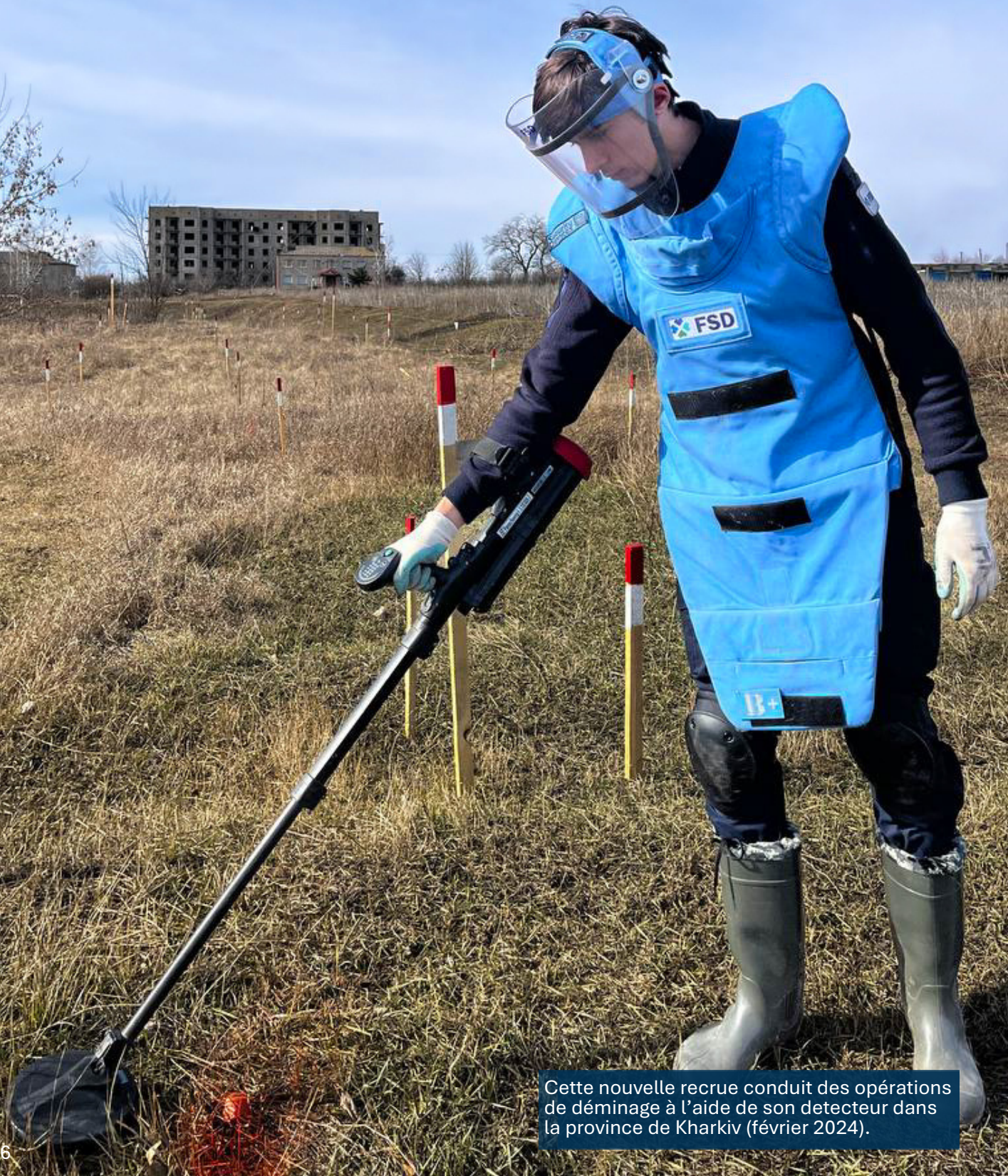
Cette nouvelle recrue conduit des opérations de déminage à l'aide de son détecteur dans la province de Kharkiv (février 2024).