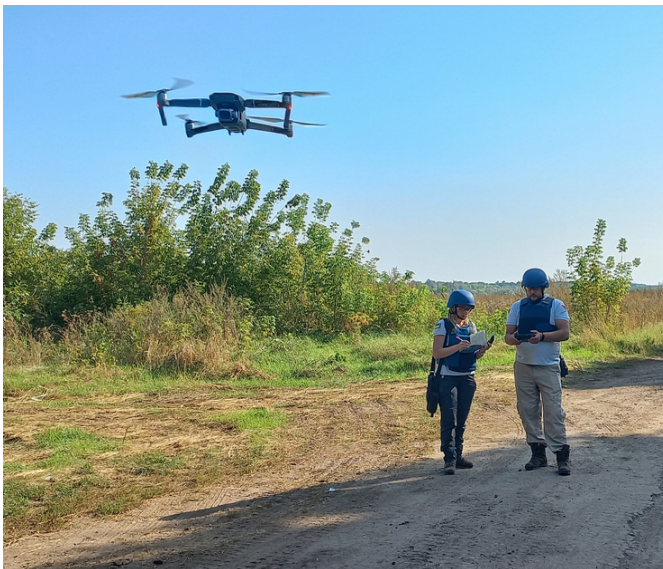
Formation du personnel de la FSD à l'utilisation de drones pour des enquêtes non-techniques (septembre 2023).

En 2023, la FSD a continué à renforcer ses capacités opérationnelles grâce au recrutement et à la formation de personnel, ainsi qu'à l'acquisition de matériel.