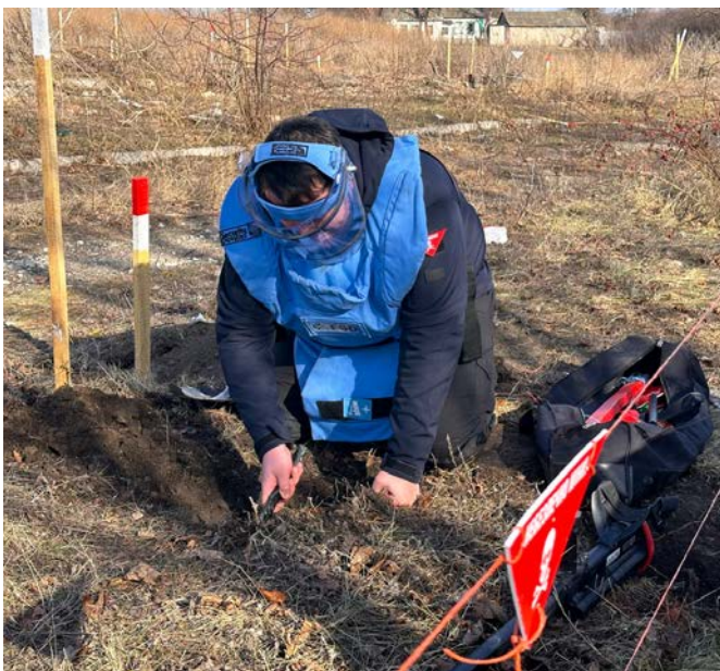
Le déminage est une tâche méthodique. Les démineur-euses examinent le sol centimètre par centimètre (février 2024).

Pour 2024, le budget opérationnel de la FSD en Ukraine s'élève à 32 millions de francs suisses. Des propositions sont actuellement examinées par différents partenaires institutionnels pour amplifier notre action et accélérer le déminage du pays.