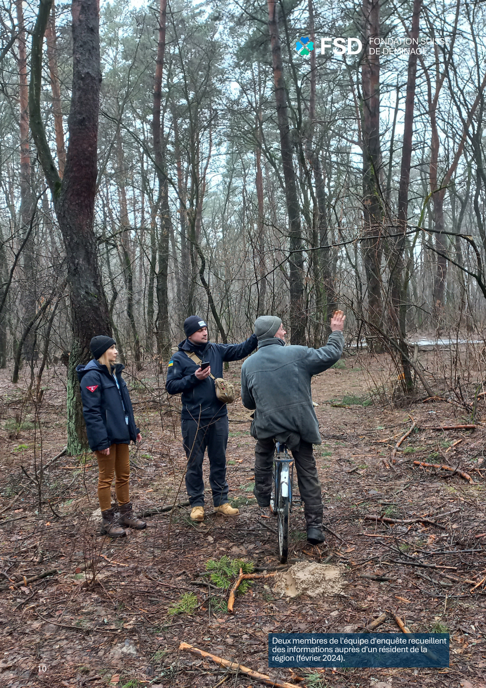
Deux membres de l'équipe d'enquête recueillent des informations auprès d'un résident de la région (février 2024).