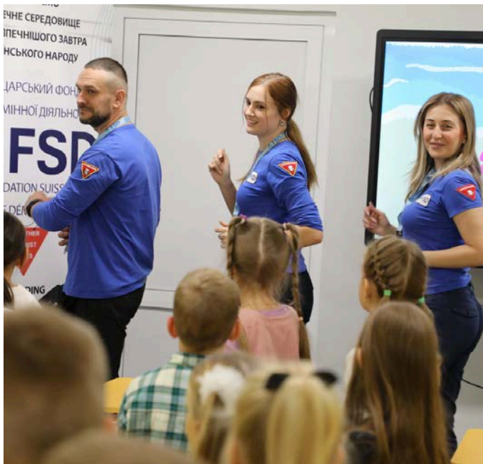
Mitglieder des FSD-Teams unterrichten Kinder in Charkiw über die Gefahren von Kampfmitteln (Oktober 2024).

Das operative Budget der FSD Ukraine für 2025 beläuft sich auf über 30 Millionen Schweizer Franken. Derzeit werden von verschiedenen institutionellen Partnern Vorschläge geprüft, um unsere Aktionen auszuweiten und die Minenräumung im Land zu beschleunigen.