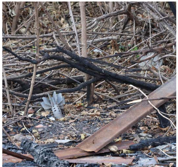
Dieser Blindgänger wurde bei einer Voruntersuchung in einem Wald in Charkiw entdeckt (Oktober 2024).