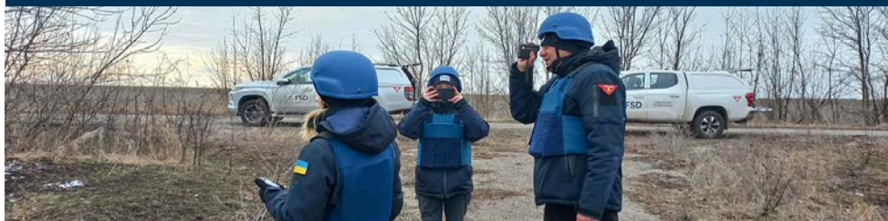
Untersuchung · Minenräumung · Risikoaufklärung · Kapazitätsaufbau