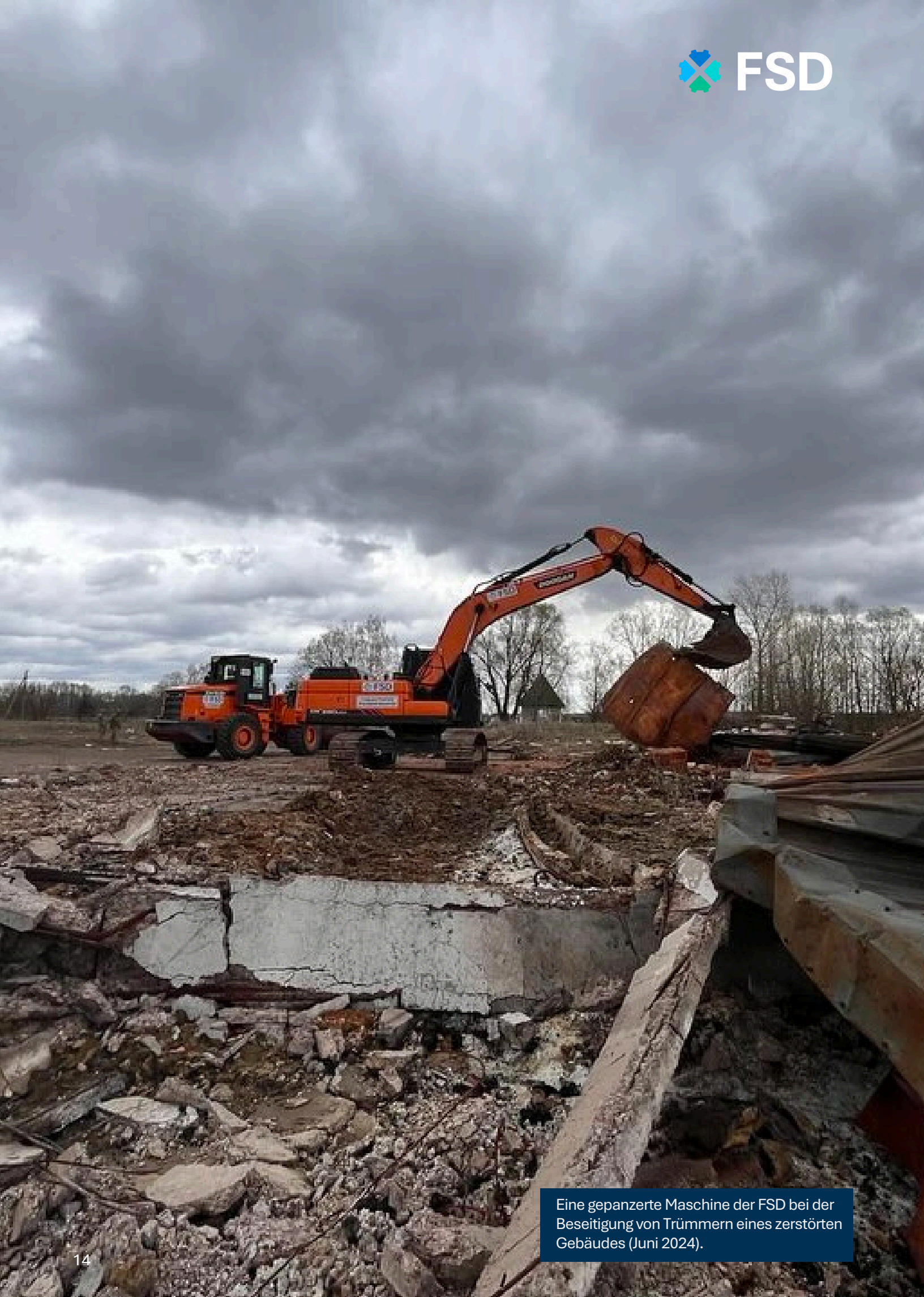
Eine gepanzerte Maschine der FSD bei der Beseitigung von Trümmern eines zerstörten Gebäudes (Juni 2024).