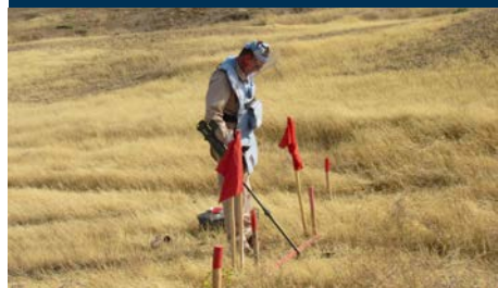
Untersuchung · Minenräumung · Risikoaufklärung