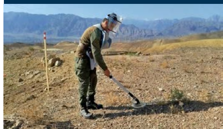
Untersuchung · Minenräumung · Risikoaufklärung · Umweltsanierung