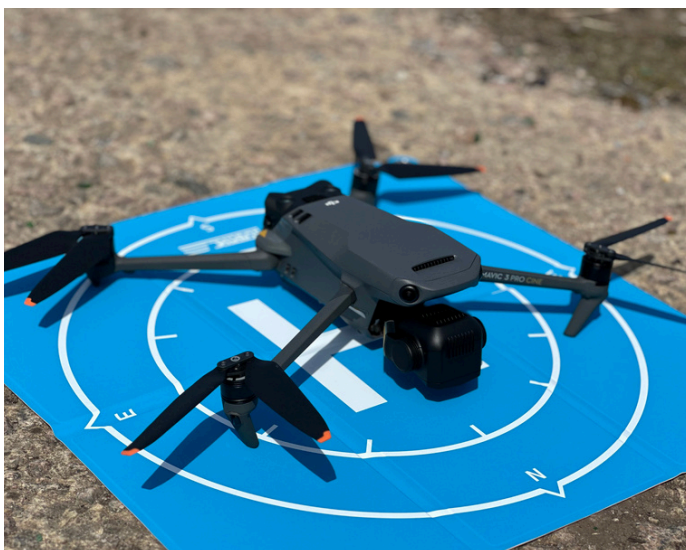
Diese Drohne hilft bei der Durchführung nicht-technischer Untersuchungen zur Identifizierung von Gefahrenstellen (August 2024).

Im Jahr 2023 erweiterte die FSD ihre operativen Kapazitäten durch die Einstellung und Ausbildung zusätzlicher Mitarbeitenden und die Anschaffung neuer Ausrüstung. Im Jahr 2024 eröffnete die FSD zwei Satellitenbüros in der Provinz Donezk und in der Nähe von Krywyj Rih, um die Einsätze im Nordosten der Provinz Cherson zu unterstützen.