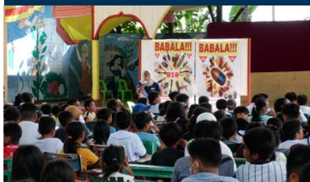
Untersuchung · Risikoaufklärung · Kapazitätsaufbau