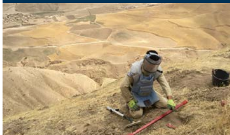
Untersuchung · Minenräumung · Minenopferhilfe