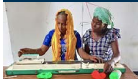
Unterstützung des Friedensprozesses · Sozioökonomische Unterstützung für Gemeinschaften