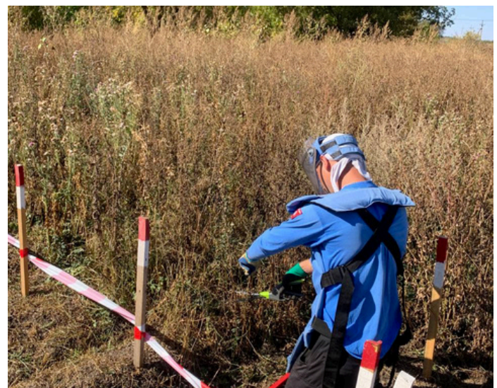
Ein Minenräumer der FSD schneidet hohes Gras, bevor er seinen Metalldetektor einsetzt, um eine sichere und effiziente Räumung zu gewährleisten (September 2024).