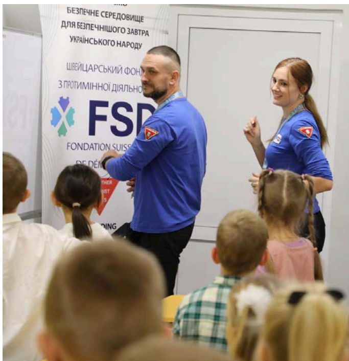
Des membres de l'équipe de la FSD lors d'une séance de sensibilisation au danger des engins explosifs dans la province de Kharkiv (octobre 2024).

Pour 2025, le budget opérationnel de la FSD en Ukraine s'élève à 30 millions de francs suisses. Des propositions sont actuellement examinées par différents partenaires institutionnels pour amplifier notre action et accélérer le déminage du pays.