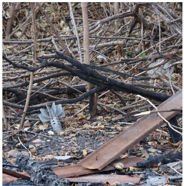
Cette munition non explosée a été découverte dans une forêt de la province de Kharkiv lors d'une enquête préliminaire (octobre 2024).