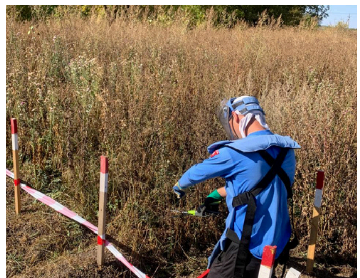
Avant d'utiliser leur détecteur de métal, les démineur·euses de la FSD coupent les herbes hautes, afin d'assurer un travail sûr et efficace (septembre 2024).