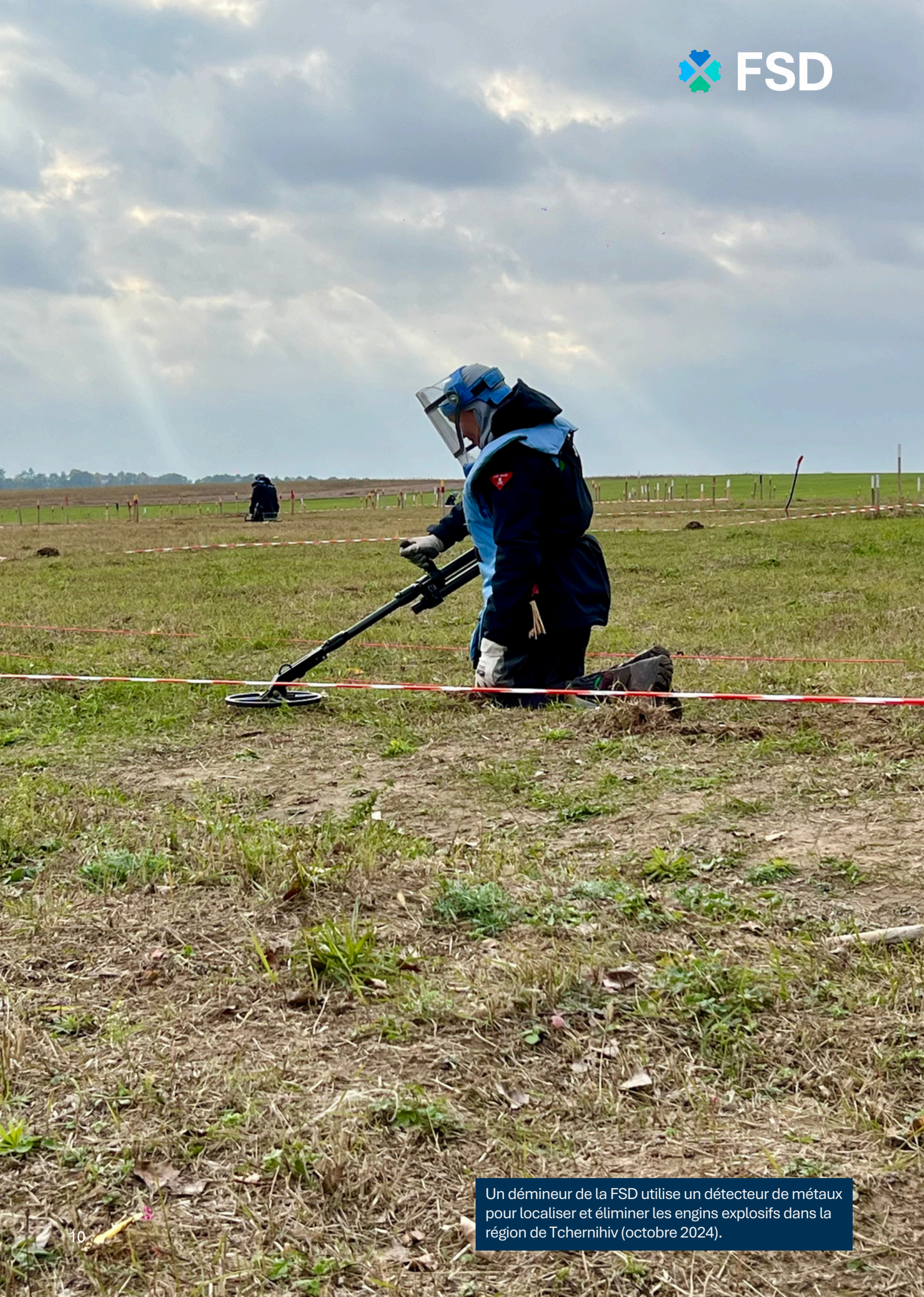
Un démineur de la FSD utilise un détecteur de métaux pour localiser et éliminer les engins explosifs dans la région de Tchernihiv (octobre 2024).